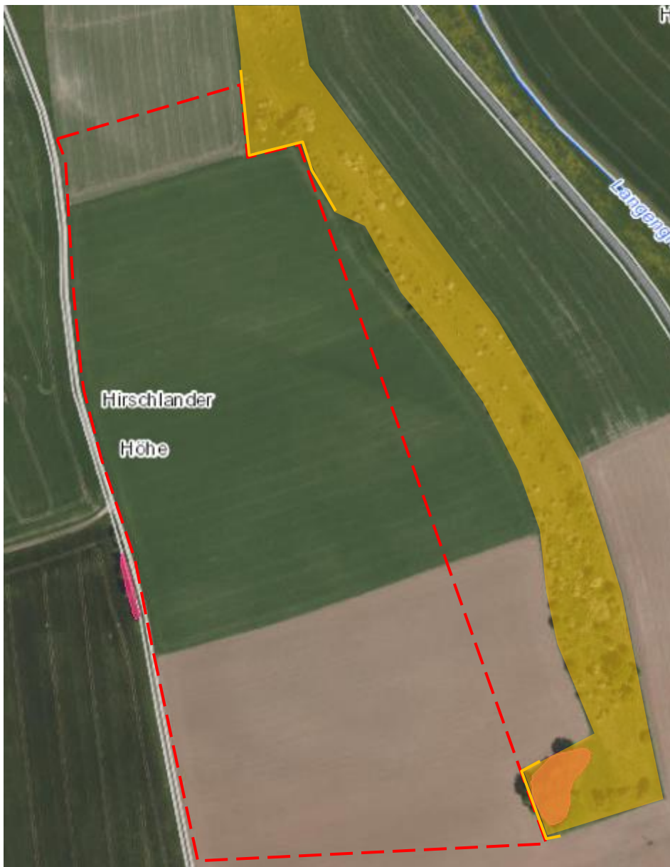
Abbildung 2: Potenzialbereiche von Reptilien randlich außerhalb des Plangebietes (flächig orange); Lage der Reptilienschutzzäune (orange Linien) (Kartengrundlage: LUBW 2021)

Aufgrund der Nähe zum Plangebiet bzw. den potenziellen Baubereichen ist nicht auszuschließen, dass Eidechse sich im Nahbereich aufhalten oder in die Baufelder einwandern können. Dadurch könnte es zu Tötungen oder Verletzungen von Tieren kommen und damit der Verbotstatbestand nach § 44 Abs. 1 BNatSchG ausgelöst werden. Durch ein Aufstellen von Reptilienschutzzäunen entlang der beiden Grenzbereiche während der Aktivitätszeit der Arten bzw. Markieren der Bereiche außerhalb dieser Zeit zur Schonung dieser Flächen randlich des Plangebietes kann ein Einwandern bzw. Tötung oder Verletzung von Tieren verhindert und damit ein Eintritt artenschutzrechtlicher Verbotstatbestände vermieden werden (siehe Kapitel 5.1.2).